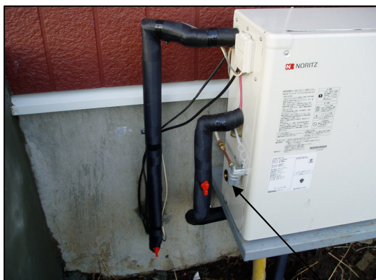
据え置き型石油給湯器

戻る http://saitosetubi.com/index.php?%BF%E5%C8%B4%A4%AD%BC%EA%BD%E7