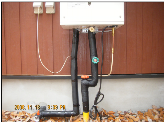
壁掛け石油給湯器